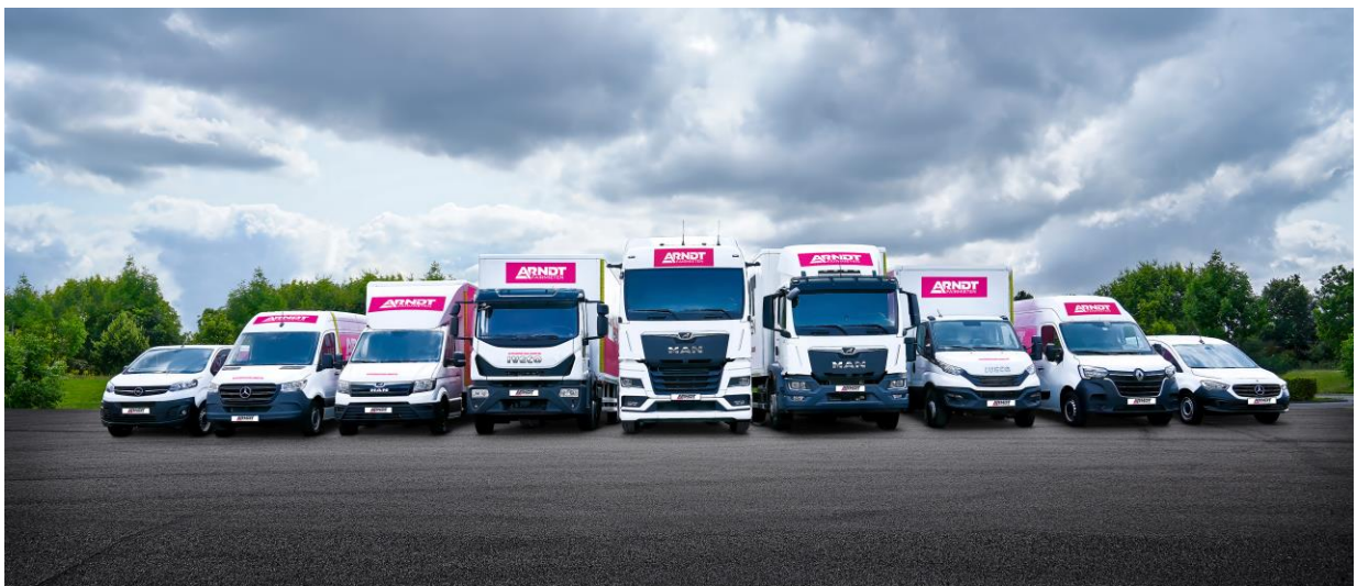
Arndt bietet eine breite Auswahl an Nutzfahrzeugen an. Vom Transporter bis zum Heavy-LKW.