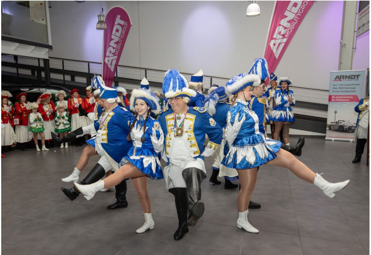
Zahlreiche Tanzvorführungen gehörten zum Programm am 11. Januar - hier die Choreografie der NKG Blaue Funken.