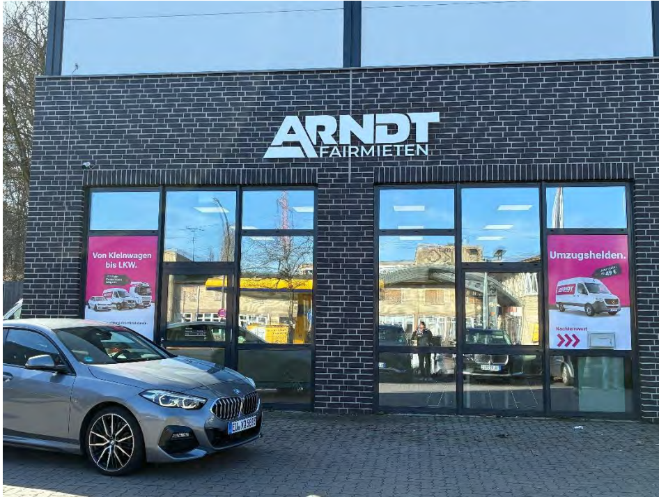
Außenansicht der neuen ARNDT-Station in Hamburg-Harburg.